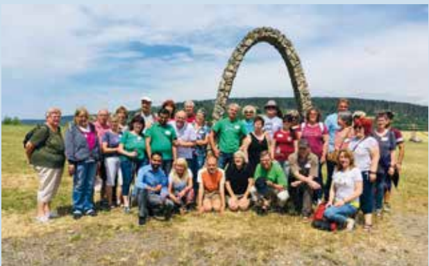
Vivere Gruppe (2019)